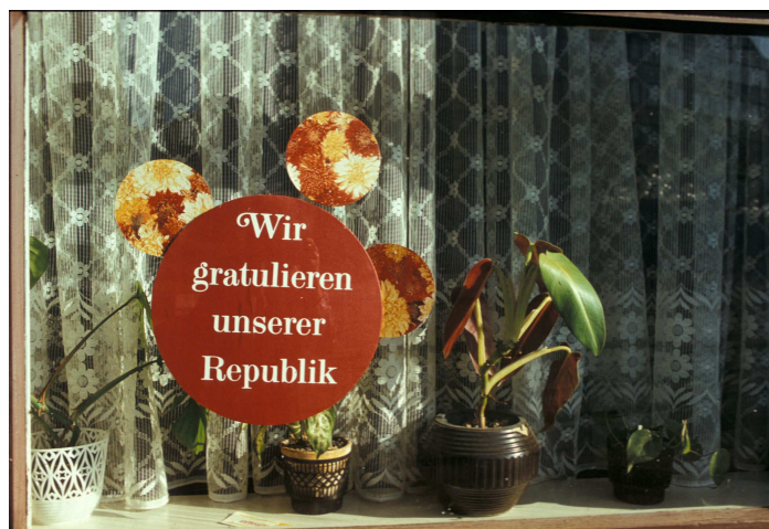
Erfurter Schaufenster, etwa 1982